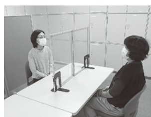
手作りのパーテーション